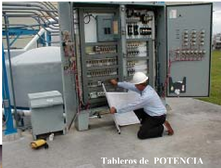
Tableros de POTENCIA